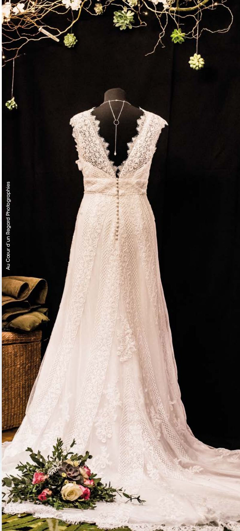
Au Cœur d'un Regard Photographies