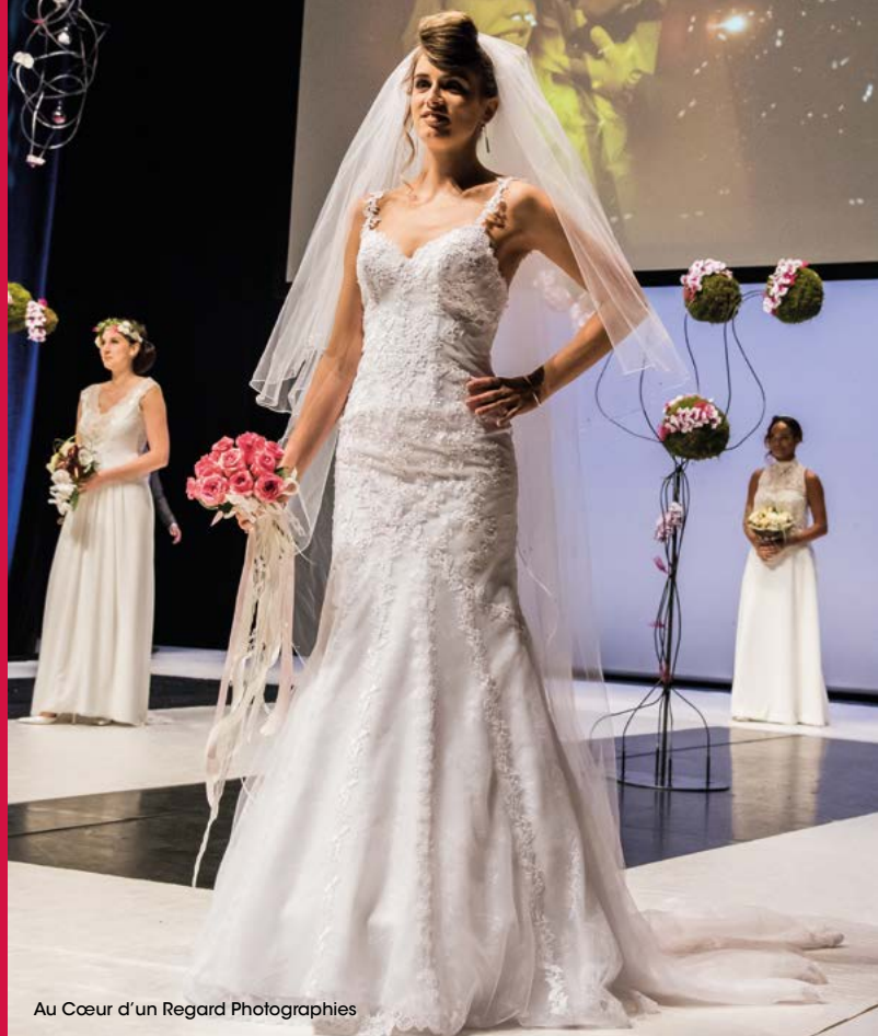
Au Cœur d'un Regard Photographies